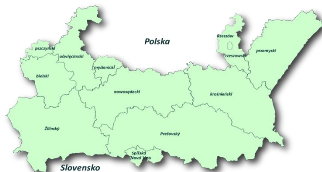
Obszar wsparcia programu

Program wspiera działania z zakresu ochrony i rozwoju dziedzictwa przyrodniczego i kulturowego, przebudowy infrastruktury drogowej usprawniającej komunikację między Polską a Słowacją oraz dostosowanie edukacji zawodowej do wymogów transgranicznego rynku pracy. Przyczynia się w ten sposób do rozwoju pogranicza polsko-słowackiego.