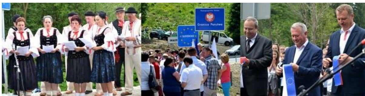
Na fotografii slávnostné otvorenie nového cestného spojenia, Jaworzynka–Čierne–Skalité, 29.05.2018.

V roku 2018 bolo úspešne dokončených viac ako desať projektov z oblasti prírodného a kultúrneho dedičstva. Ich výsledkom je viac ako 190 km nových, zmodernizovaných alebo zdokonalených cezhraničných rekreačných chodníkov. Skončila sa aj realizácia siedmich investícií do cestnej infraštruktúry. Vďaka realizácii týchto projektov bolo zrekonštruovaných alebo zmodernizovaných viac ako 100 km ciest. Boli ukončené aj prvé dva vzdelávacie projekty, v rámci ktorých sa uskutočnilo 21 spoločných školení, na ktorých sa zúčastnilo približne 1560 účastníkov.