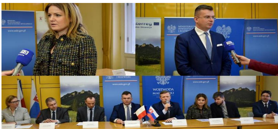
Na fotografii slávnostné vyhlásenie výzvy na predkladanie žiadostí (Krakov, 5.03.2018).

Zároveň sa v roku 2018 uskutočnili dve výzvy na nové projekty. Súbežne s nimi sa realizovali intenzívne informačné a propagačné aktivity. Ich cieľom bolo povzbudiť k účasti na súťaži a predstaveniu nápadov na aktivity, ktoré by boli impulzom k rozvoju cezhraničnej dopravy medzi Poľskom a Slovenskom, a k rozvoju vzdelávania prispôsobeného požiadavkám trhu práce v pohraničí. Informácie o výzvach boli uverejnené v miestnych médiách na poľskej aj slovenskej strane, na webových stránkach a v sociálnych médiách.