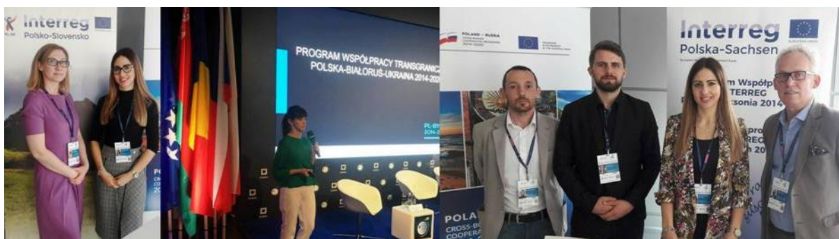
Na fotografii IV. Európsky kongres samospráv v Krakove 26.-27.04.2018

Významnou propagačnou aktivitou programu počas spomenutého Ekonomického fóra v Krynici bola účasť na diskusnom paneli, ktorý bol venovaný cezhraničnej spolupráci. Mimoriadnym podujatím bolo odovzdávanie cien výnimočným karpatským projektom: „Chodník valašskej kultúry“ a „Karpatské nebo“. Je zaujímavé, že už teraz možno pozorovať inšpirujúci vplyv zrealizovaných projektov na vznik nových, zaujímavých iniciatív. Napríklad projekt „Historicko - kultúrno - prírodná cesta okolo Tatier“ sa stal inšpiráciou pre iný projekt „Vysoké rašeliniská – európsky unikát poľsko-slovenského pohraničia“. V rámci neho vznikli, okrem cyklotrasy prebiehajúcej cez rašeliniská, dve múzeá: Centrum prírodného dedičstva „Múzeum rašelinísk“ – interaktívne múzeum rašelinísk v Chocholówe a prírodovedné múzeum na nádvorí Oravského hradu na Slovensku. V súťaži Európskej komisie RegioStars bol tento projekt ocenený ako jeden z najzaujímavejších, najoriginálnejších a najviac inovačných zámerov na úrovni celej Európy.