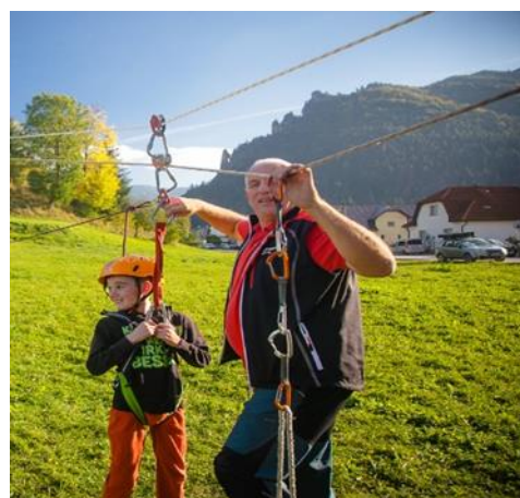
Na fotografiách Výročné podujatie programu v Terchovej, 6.10.2018.

Motto aktivít v roku 2018 bolo „Spoločne obohacujeme poľsko-slovenské pohraničie“. Znamená to, že vďaka realizácii projektov, ktoré získali finančný príspevok zo zdrojov programu, sa v poľsko-slovenskom pohraničí uskutočňujú zmeny, ktoré môže využiť každý.