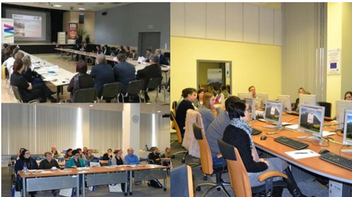
Na fotografii školenia v Krakove a Bielsku-Białej.

Osoby, ktoré sa zúčastnili na školeniach, boli pozvané na stretnutia do Krakova, Rzeszowa, Bielska-Białej, Prešova a Žiliny. Počas spoločných školení a individuálnych konzultácií sa oboznámili s najdôležitejšími aspektmi realizácie projektov. Väčšinou išlo o osoby zodpovedné za projektové a finančné riadenie.