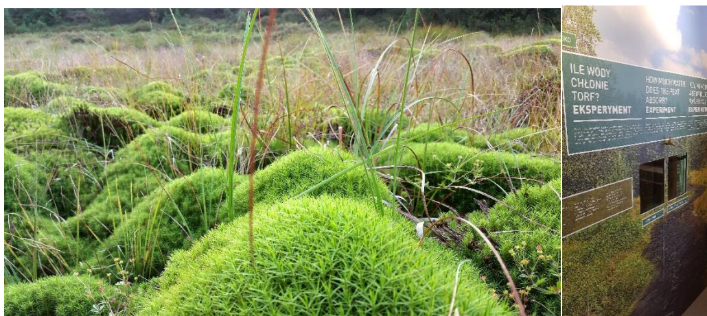
Na fotografii projekt „Vysoké rašeliniská“.

Významnou propagačnou aktivitou programu počas spomenutého Ekonomického fóra v Krynici bola účasť na diskusnom paneli, ktorý bol venovaný cezhraničnej spolupráci. Mimoriadnym podujatím bolo odovzdávanie cien výnimočným karpatským projektom: „Chodník valašskej kultúry“ a „Karpatské nebo“. Je zaujímavé, že už teraz možno pozorovať inšpirujúci vplyv zrealizovaných projektov na vznik nových, zaujímavých iniciatív. Napríklad projekt „Historicko - kultúrno - prírodná cesta okolo Tatier“ sa stal inšpiráciou pre iný projekt „Vysoké rašeliniská – európsky unikát poľsko-slovenského pohraničia“. V rámci neho vznikli, okrem cyklotrasy prebiehajúcej cez rašeliniská, dve múzeá: Centrum prírodného dedičstva „Múzeum rašelinísk“ – interaktívne múzeum rašelinísk v Chocholówe a prírodovedné múzeum na nádvorí Oravského hradu na Slovensku. V súťaži Európskej komisie RegioStars bol tento projekt ocenený ako jeden z najzaujímavejších, najoriginálnejších a najviac inovačných zámerov na úrovni celej Európy.