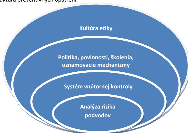
Schéma č. 2. Štruktúra preventívnych opatrení.